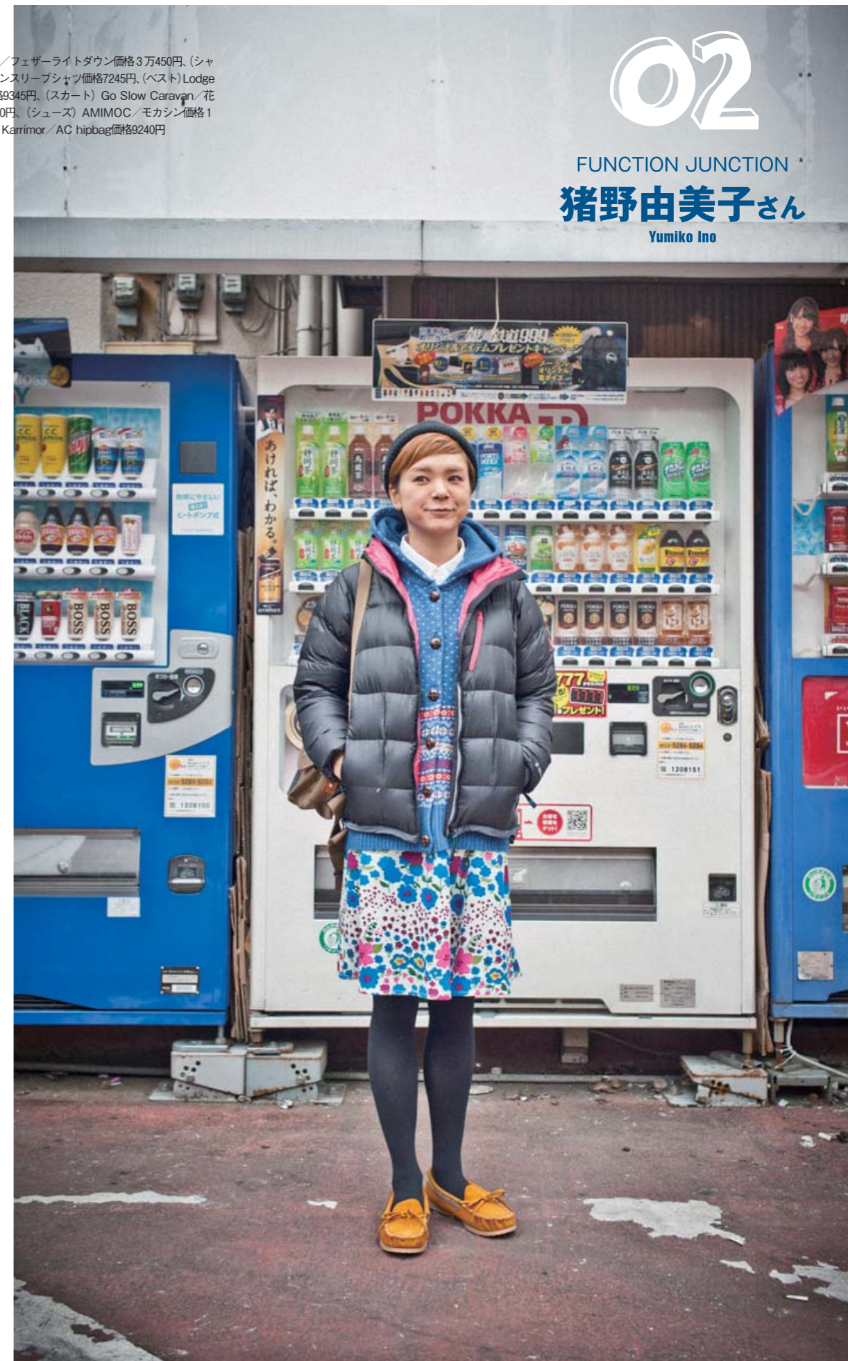
(ダウン) Karrimor/フェザーライトダウン価格3万450円、(シャツ) Lodge/ドルマンスリーブシャツ価格7245円、(ベスト) Lodge/ニットベスト価格9345円、(スカート) Go Slow Caravan/花柄スカート価格4830円、(シューズ) AMIMOC/モカシン価格1万290円、(バッグ) Karrimor/AC hipbag価格9240円