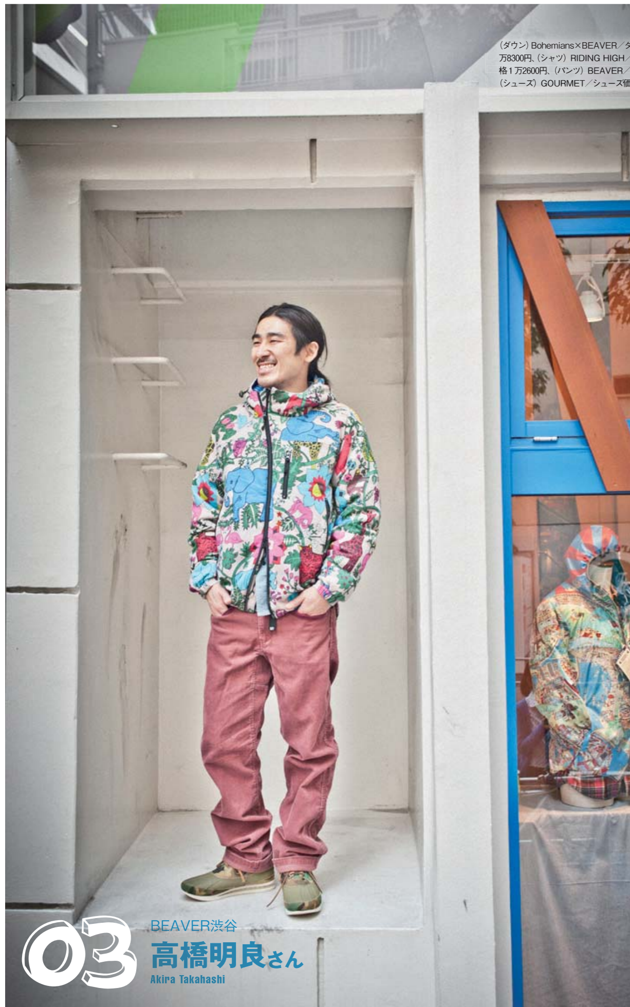
(ダウン) Bohemians×BEAVER/ダウンジャケット価格4万8300円、(シャツ) RIDING HIGH/シャンプレーシャツ価格1万2600円、(パンツ) BEAVER/パンツ価格1万4490円、(シューズ) GOURMET/シューズ価格2万3940円