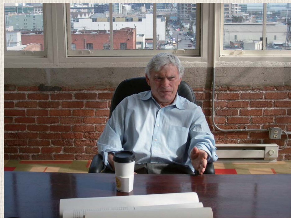
スタンフォードを卒業したばかりのハップ・クロップは、スリーピングバッグを作る小さなショップに資金提供。その後社長となり、ザ・ノース・フェイスの歴史を作り上げた。