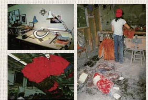
創業当時は、小さな工場で、ダウンまみれになってプロダクトを制作。ここで、同ブランドの基礎となるスリーピングバッグやシエラパーカが生み出された。