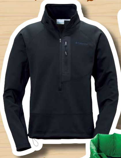
Terley 1/2 Zip