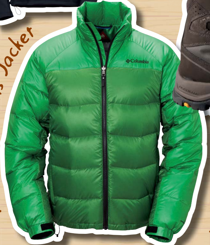
Rockaway Dens Jacket

テトリ-1/2 Zip 軽量なストレッチフリースを採用した中間層に最適な一着。長めのハーフジップを装備し、ウエア内の温度を調節しやすい。表面はフラットゆえレイヤリング時にごわつかない。オムニヒートサーマルリフレクティブを搭載。肩部分は立体裁断で腕の上げ下げもストレス。紫外線の98%を遮断するサンプロテクション機能も備える。価格8190円