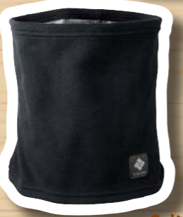
Thermarator Neck Gaiter