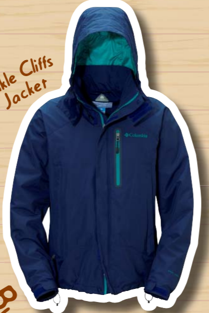
Teakle Cliffs Jacket

既存の素材や技術に頼らず様々なアクティビティやシーンに合わせたテクノロジーを自社で開発、オリジナルティ溢れる製品を発信する「コロンビア」。コストパフォーマンスの高さにも定評があり、またウエアだけでなくバックパックからアクセサリーまで展開する総合ブランドだけにフィールドのみならず街で目にすることも多い。そんなコロンビアの秋冬アイテムを代表するテクノロジーが「オムニヒート」だ。体の熱を外へ逃さず、体温のロスを軽減し、あたたかさをキープ。この独自技術の特徴は、アウトドアギアのジャンルを解消しているところにある。あちらを立てればこちらが立たず、ということがアウトドアギアにもある。代表的なのが防水性と透湿性の関係で片方を高めれば一方が低下し、両方を最大限まで高めるのは難しい。同じような関係にある保温性と透湿性。軽量性を高い次元で実現させたのがオムニヒートなのだ。「オムニヒートサーマルリフレクティブ」の保温効果は裏地のアルミニウムの働きによるが、リフレクティブプリントをドットパターン状に配することで生地本来の透湿性も損なわれない。さらに放電を促し静電気も抑えられる。「オムニヒートサーマルインシュレーション」は、太さの異なる繊維を組み合わせることで繊維間のすきまを大きくし、少量で高い口フトを作り出している。ただ暖かいだけでなく、蒸れずに軽いオムニヒートギアは、フィールドユースから普段着まで幅広いシーンで重宝していった。