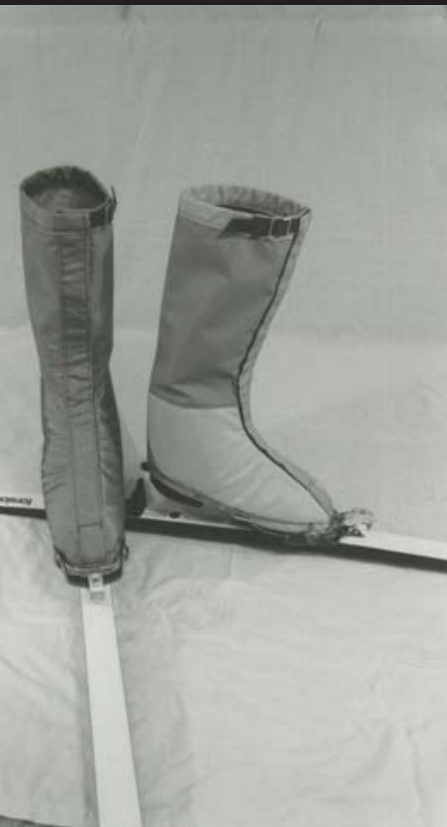
X-Gaiterと共に、創設期に製作されたX-Gaiterプロトタイプ。こちらも、靴との間に雪が入らないよう、工夫され作られたスキーブーツだ。創設期は、バックカントリー向けのギアに焦点が絞られ、製作されており、他には寒冷地でも水筒内の水が凍結しないポトルバーカなどがある。ポトルバーカは今でも購入することができるロングセラーアイテムだ。