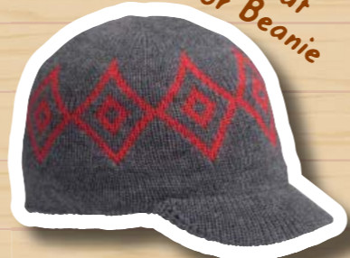
Diamond Heat Visor Beanie