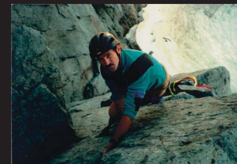
上：アウトドアリサーチ創設者の自然科学者ロン・クレグのクライミング風景。「自らの経験、アドベンチャーによって全てのギアは作られる」という理念の元、ロン自身多くのアウトドアアドベンチャーを楽しんだ。ロンのごうしたフィールドでの活動が、数多くの機能的で革新的なウエア及びギアを生み出していった。左：ロンはアイスクライミング、アルパインクライミング……と、ありとあらゆるアウトドアアクティビティに出かけた。

1980年、アラスカ最高峰マウント・デナリ。マウンテンアリソングを愛する自然科学者のロン・クレグとそのパーティーは危険な状況にさらされた。極寒の中、ひとりか重度の凍傷を負ったのだ。脚にはゲイターを装着していたものの、マウント・デナリの厳しい気象状況の中では、全く役に立たず、みるみるうちに症状は悪化していった。レスキューの力を借り、無事に下山したロンは、二度と同じ状況に合わない為に、この事故を教訓に、ゲイターの製作を始