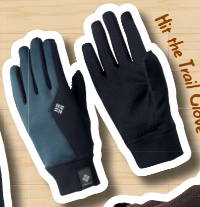
Hit the Trail Glove