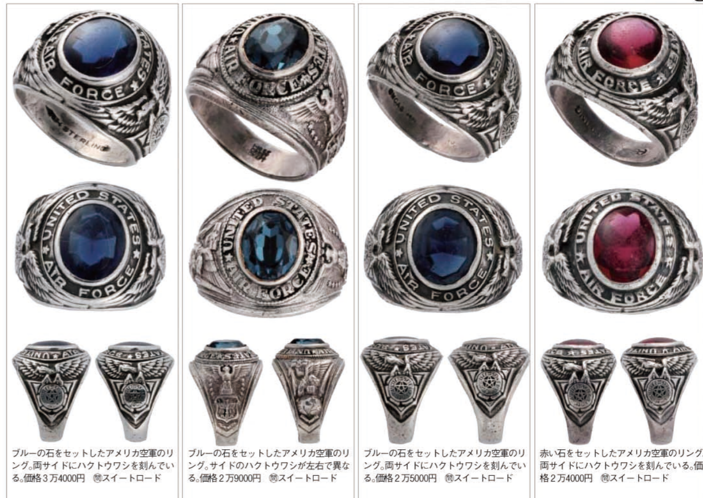
ブルーの石をセットしたアメリカ空軍のリング。両サイドにハクトウワシを刻んでいる。価格3万4000円