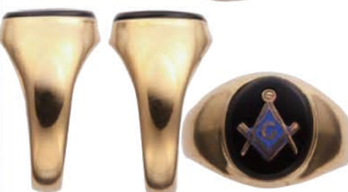
18kゴールド製のフリーメイソンリング。オーバル型の黒い石に、コンパスと定規にGマーク。価格18万9000円 ㊟インスタック