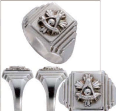
1960年代のもの。コンパス、半円形の定規、太陽のマーク。パストマスターという階級のもの。価格1万7800円 ㊟マービンス