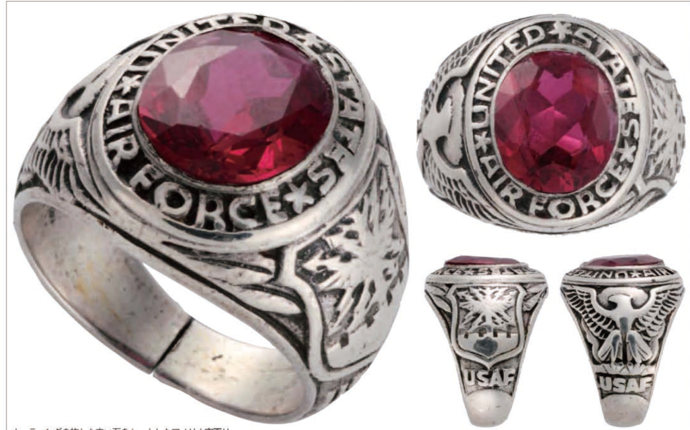
カッティングを施した赤い石をセットしたアメリカ空軍リング。サイドにハクトウワシと空軍省の記章のデザインを刻んでいる。価格2万5000円