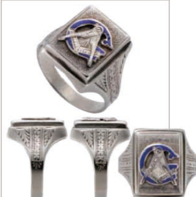
1950年代のフリーメイソンリング。スクエア型の台座に大きなGマークとコンパス&定規。価格1万8800円 ㊟マービンス