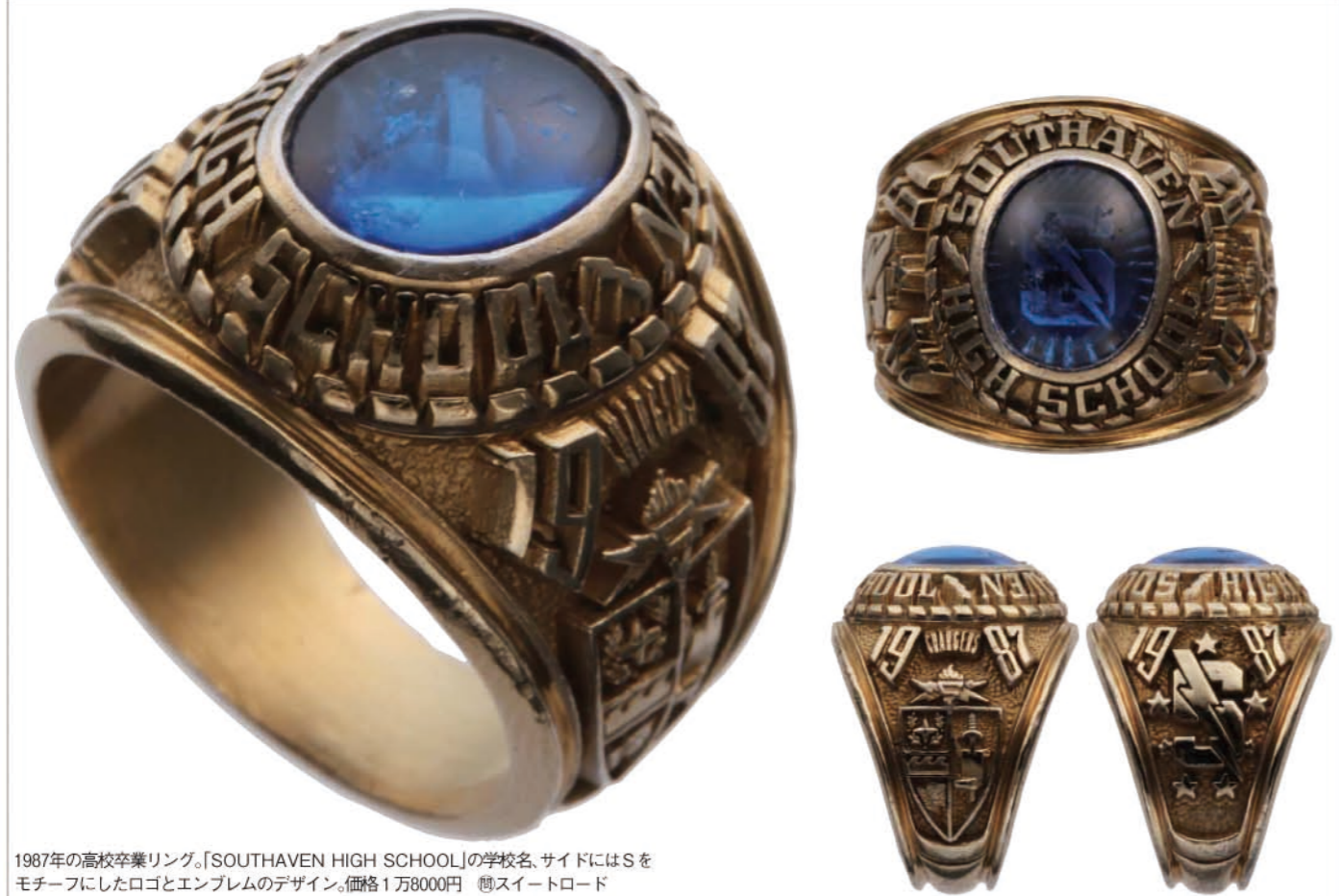
1987年の高校卒業リング。「SOUTHAVEN HIGH SCHOOL」の学校名、サイドにはSをモチーフにしたロゴとエンブレムのデザイン。価格1万8000円