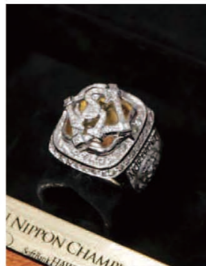
ホワイトゴールドの土台に120個のダイヤモンド、トバース系の天然石がセットされている。サイドには選手名、背番号、チームマスコット、ヤフードームが緻密に描かれている。フィリップ・カレッジリング製。