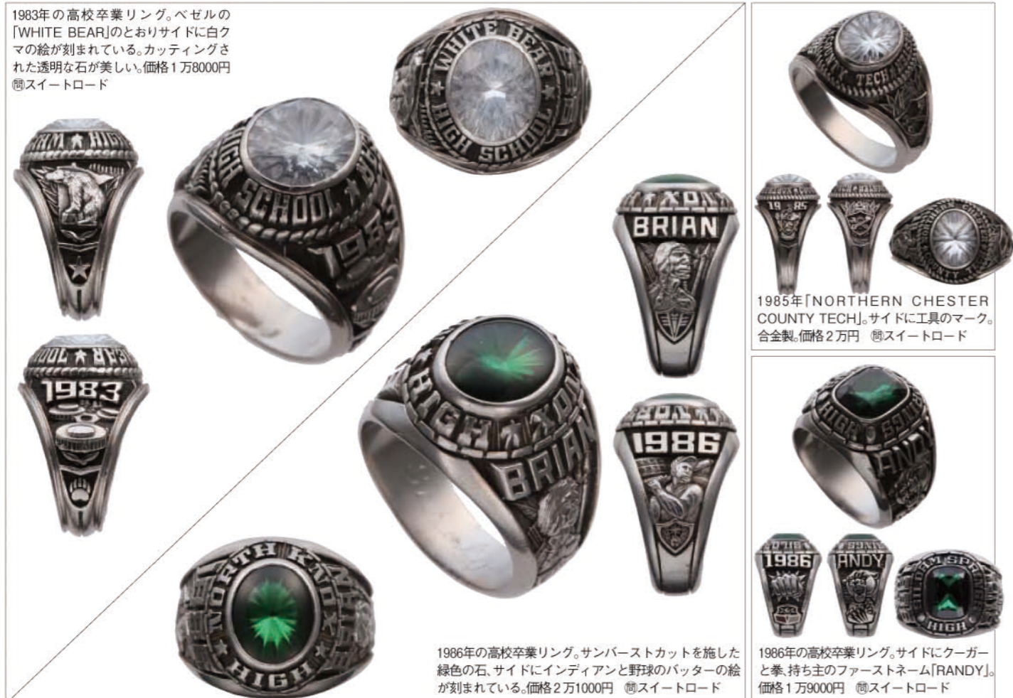
1985年「NORTHERN CHESTER COUNTY TECH」。サイドに工具のマーク。合金製。価格2万円