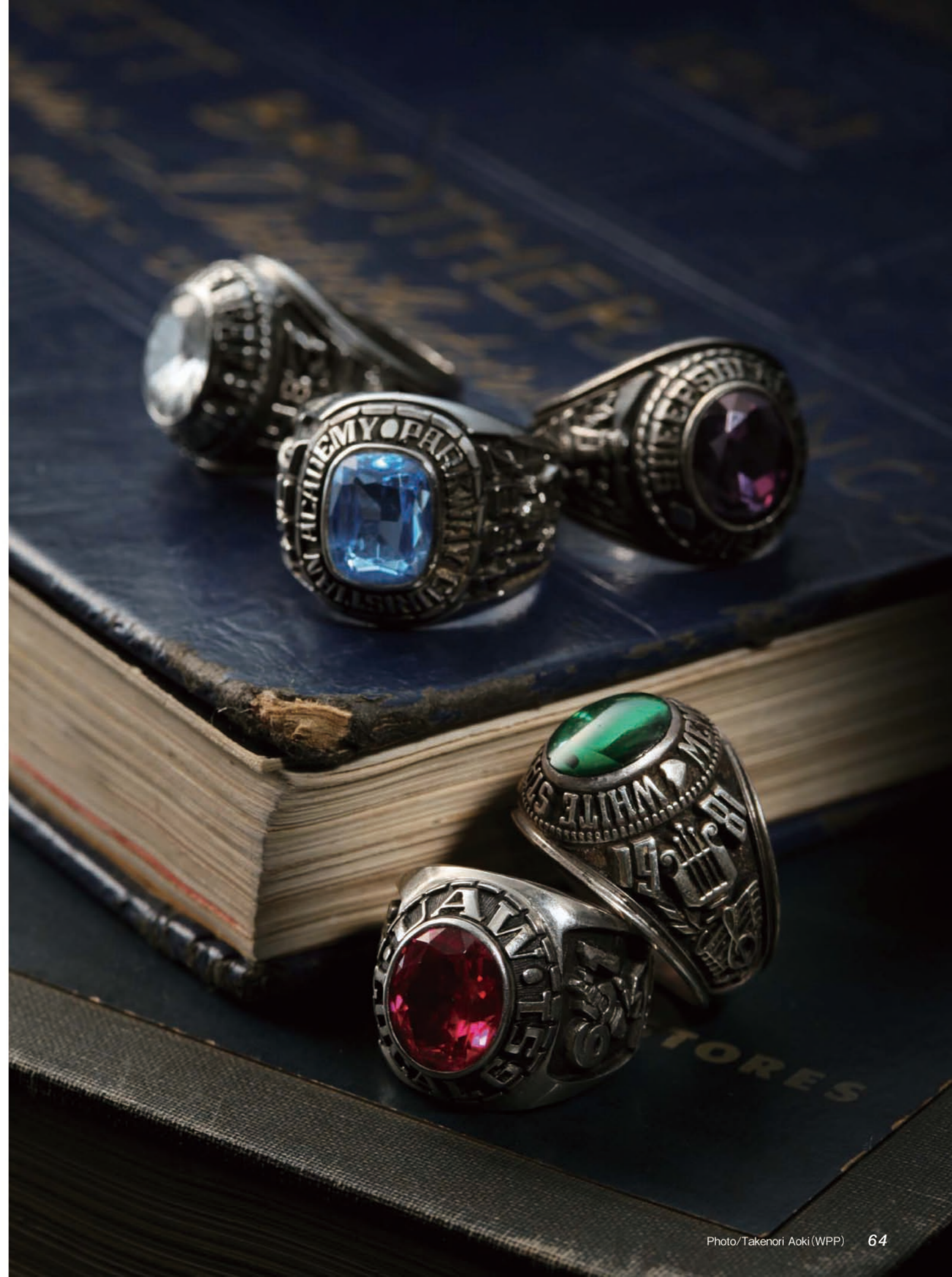
1986年の高校卒業リング。サイドにクーガーと拳、持ち主のファーストネーム「RANDY」。価格1万9000円