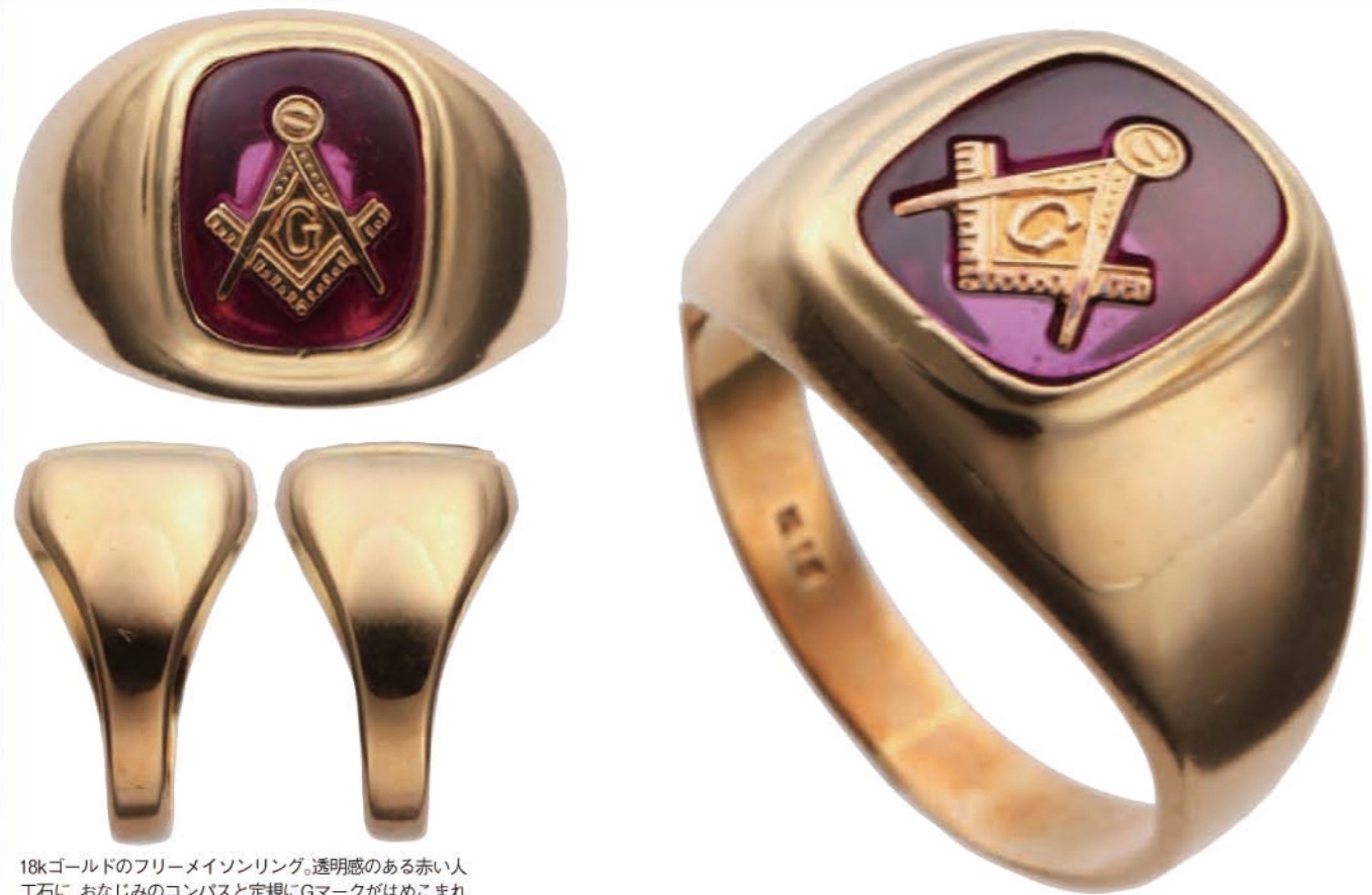
18kゴールドのフリーメイソンリング。透明感のある赤い人工石に、おなじみのコンパスと定規にGマークがはめこまれている。価格10万5000円 ㊟インスタック