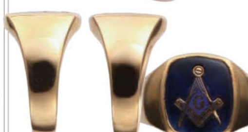
18kゴールド製のフリーメイソンリング。スクエア型のブルーの石に、コンパスと定規にGマーク。価格21万円 ㊟インスタック