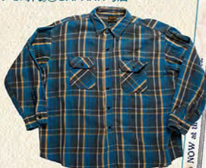
1960年代のフランネルシャツは、ポケットにフラップが付き柄はバイアス取りになっている。@WAREHOUSE