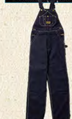
ワシントンディーシーのフラッシュが付いたデッドストックのオーバーオール。@BOTTOM LINE