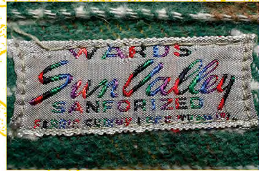
サンヴァレイというブランド名はア イダホ州にある有名なスキー場 からとっている。1936年、鉄 道王と呼ばれたユニオンパ シフィック鉄道の会長ア ペレルハリマンによっ て不況下のアメリカで スキーリゾートをめざし て造られたスキー場で、 ヘミングウェイなど、多 くの著名人が訪れたとい う。当時のスキー場の広告 と同じ字体のこのサンヴァ レイは、スキーノードウェアをイ メージして作られたものと考えら れる。