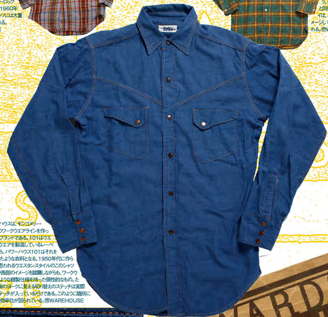
パワーハウスはモンゴメリー ワードのワークウェアラインを作っ ていたブランドである。101はウエ スタンウェアを製造しているレー ベルだから、パワーハウス101はそれ を合わせたような衣料となる。1950年代に作ら れたと思われるウエスタンスタイルのこのシャツ も、やや西部のイメージを踏襲しながらも、ワーク ウェアのような縫製仕様を持った個性的なもの。た とえば胸のヨークに見える切り替えのステッチは実際 にはステッチが入っているだけである。このように随所に 生産の効率化が図られている。