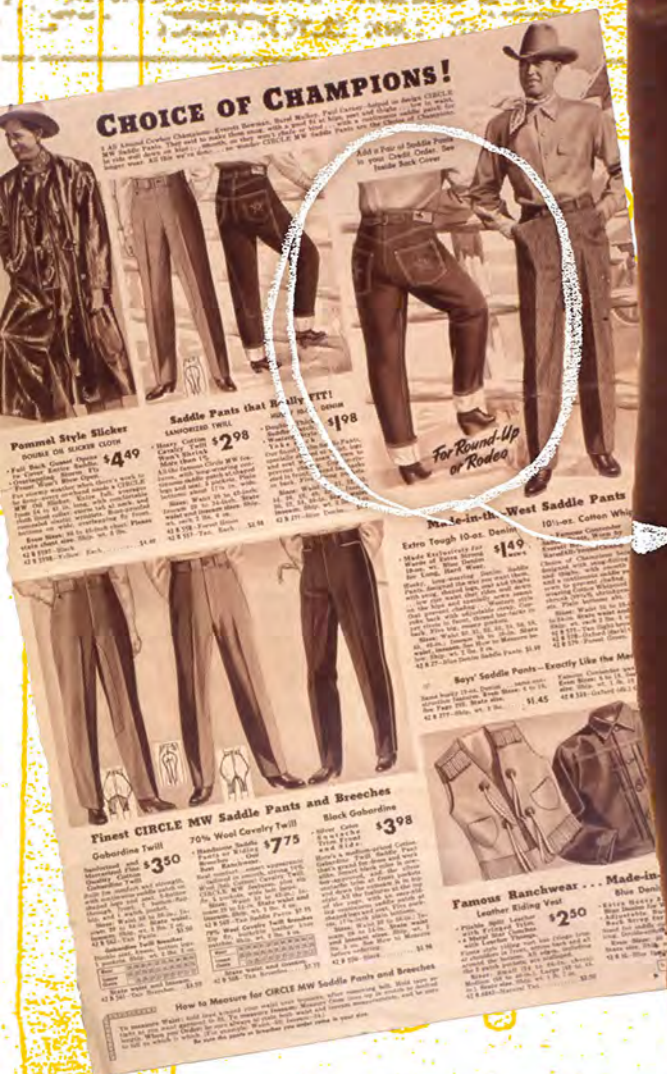
モンゴメリーワードのオリジナルのデニムパンツもイメージをカウボーイにおいていた。このステッチが入るこのモデルは、「チャンピオンが選ぶもの」と謳いカウボーイが好みそうなデザイン、ネーミングで打ち出している。1930年代のバックルバッグモデル。バックポケットにはスレッドリベットが打たれている。

シカゴのセントポールで、都市から買 い付けた商品を地方都市のジェネラ ストアへ行商していたアーロン・モンゴメリー ワードは大都市の小売価格と地方のジェネラ ストアの小売価格の違い、さらには品揃えの悪 さに気付いていた。地方の貧しい農村で真面目 に働く労働者が、法外な値段で販売されるワー クウェアや日用品を買わざるを得ない状況をな