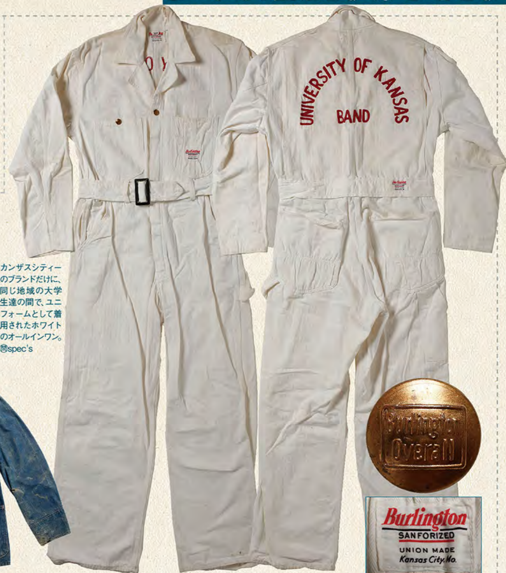
カンザスシティのブランドだけに、同じ地域の大学生の間で、ユニフォームとして着用されたホワイトのオールインワン。 @spec's