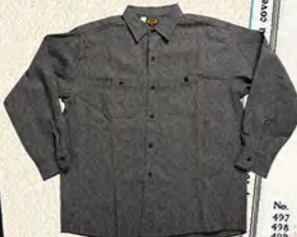
1960年代のブラックシャンプレーシャツ。シャツの裾がラウンドしていないボックス型になっている。@JAM