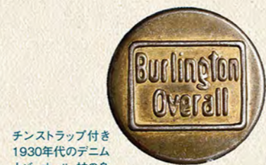
チンストラップ付き1930年代のデニムカーオーバーオール。袖の身返しは外に付いている。 @WAREHOUSE