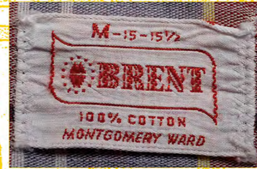
ブランドは1960年代に最も多 数の商品を生産しているブランドで、 モンゴメリーワードの中 には、デイリーカジュアル ウェアを製造している。ス ウェット、ボタンダウン シャツ、オープンカラ ーシャツやニットな どが多く見られるが、 それまで本格的だった 部分にチェーンステッチ が使われ、インターロック 処理がされるなど、1960年 代のボタンダウンシャツには大量 生産の仕様が見られる。 ©WAREHOUSE

は表紙や目次に必ず「GRANGERS」（農民共 済組合）を掲示し、これら地方の農村のファ ーマーへの特典として割引なども付けている。最 も苦しめられた人を味方に付けることによって、 メールオーダーシステムは次第に広がり、20世 紀を迎える頃には急成長を遂げている。また同 社はJ.C.ペニーとは逆に、1926年に実店舗で ある小売店を展開している。