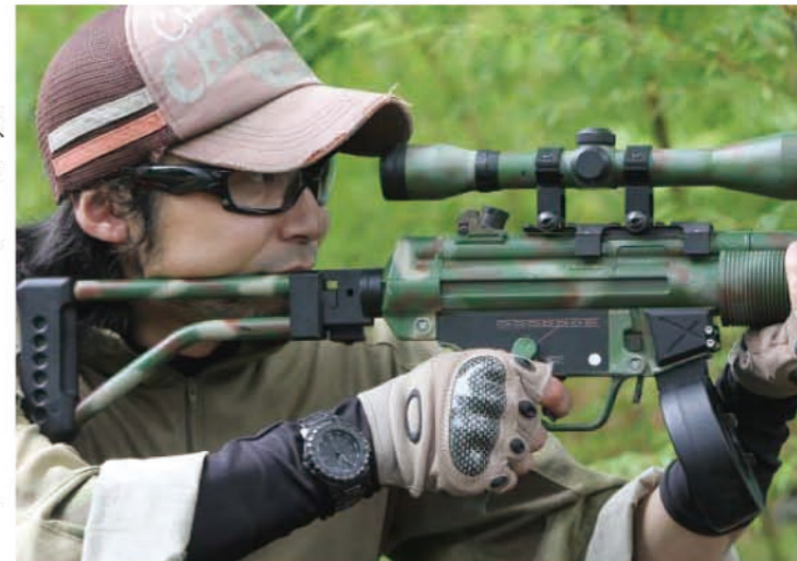
シューティンググラスタイプのゴーグルは、圧迫感がなく呼吸しやすいという利点はあるが、顔をヒットされた時のことを考えると少々不安だ。

サバゲーでは自分の体にBB弾が当たると「ヒット」となり、自己申告をしてフィールドから退場する。相手チームの撃った弾はもちろん、味方チームに間違えて撃たれてもヒットとなる(ヒット判定の定義は、自分の全身と装備品、エアガンへのヒットが対象)。また壁や天井、樹木などに当たって跳ね返った弾(跳弾)もすべてヒット扱いとなるので注意。