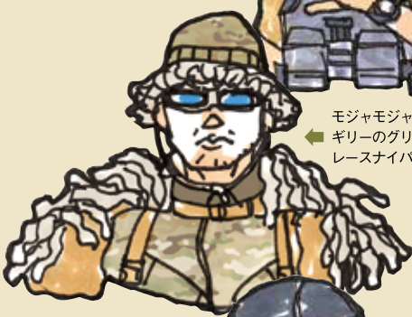
モジャモジャハーフギリーのグリーンベレースナイパー。