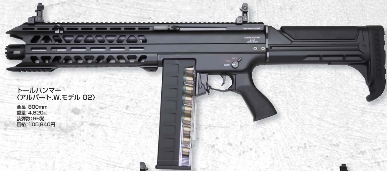
トールハンマー 〈アルバート.W.モデル 02〉