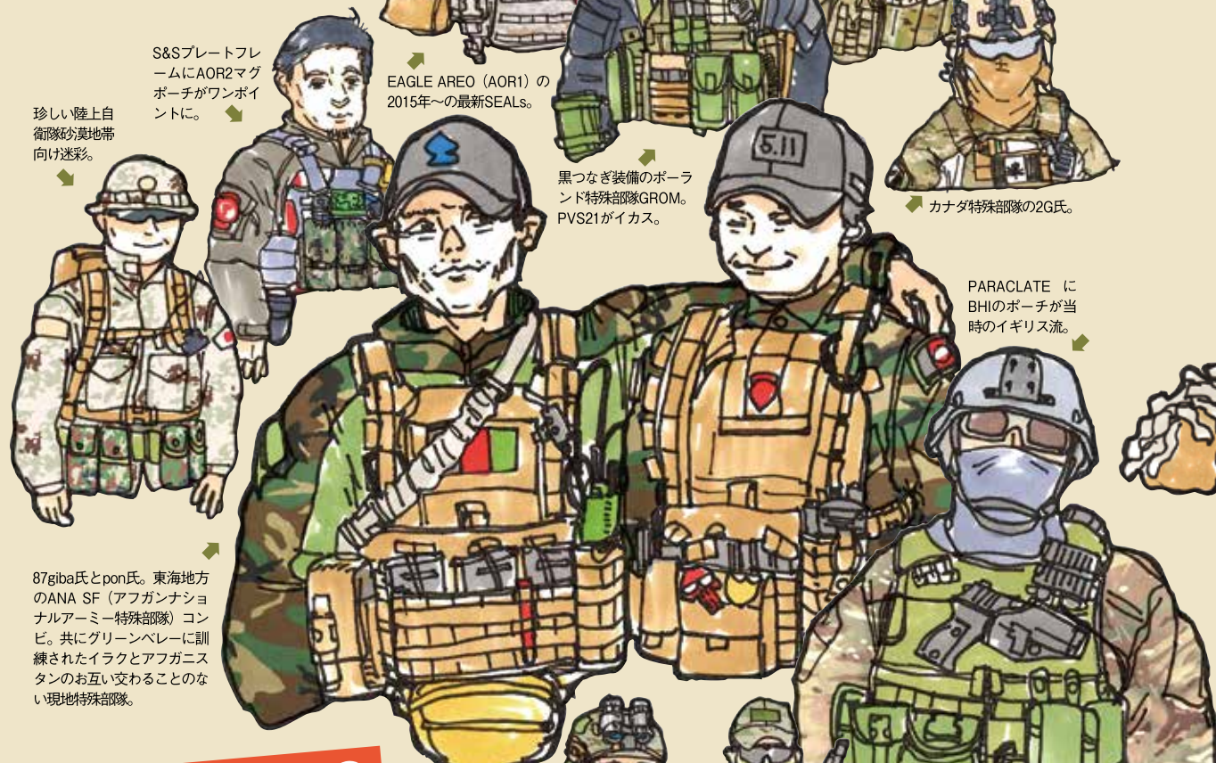
S&SプレートフレームにAOR2マグポーチがワンポイントに。 珍しい陸上自衛隊隊員地帯向け迷彩。