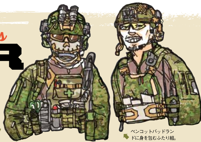
ペンコットパッドランドに身を包むふたり組。国内じゃなかなか手に入りづらいとか。

C☆Mの新星イラストレーター、DJちゅう。 現用装備好きとあって、 はるばる九州から駆けつけました! そのクールな目と、豊富な知識でセレクトした GEARFESに集いし、歌舞伎者たち! ずずずいっと、すみからすみまで、 まずはご照覧、ご照覧!