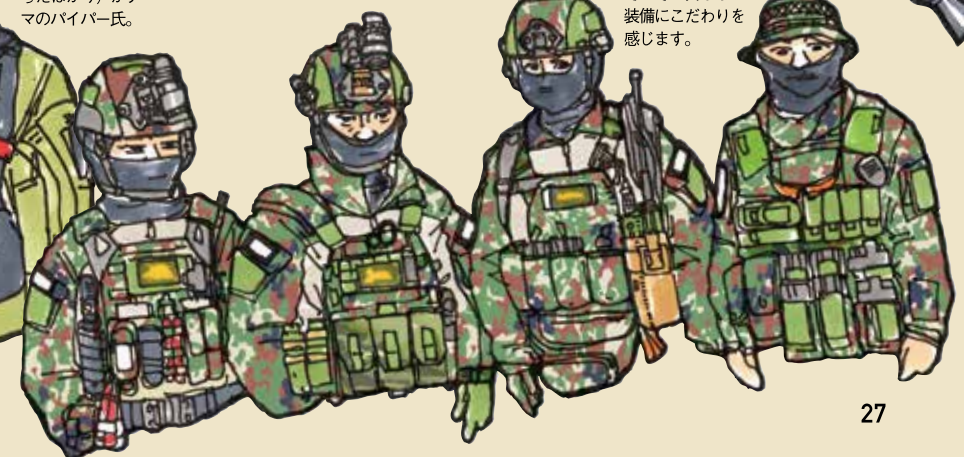
陸自装備の4人衆。それぞれ異なった装備にこだわりを感じます。