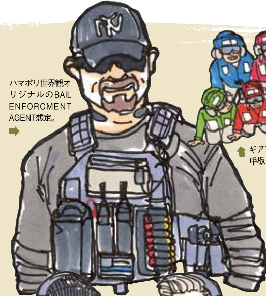
ハマポリ世界観オリジナルのBAIL ENFORCEMENT AGENT想定。