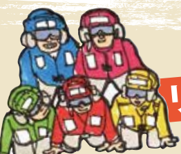
ギアフェス名物!? 甲板レンジャーズ。