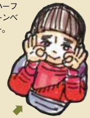
ミルフリースのお馴染み、まめさん。