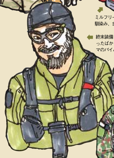
終末装備 (終末になったばかり) がゲームのバイバー氏。