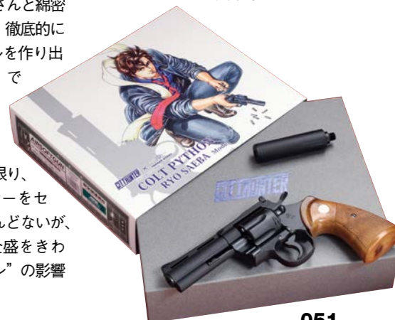
カバーを外すと、『シティーハンター』のロゴをあしらった化粧箱。コレクターズ・アイテムにふさわしい演出だ。

タナカでは、シティーハンターのパイソンをモデルアップするにあたって、もともと原作のファンでもあったスタッフが、北条 司さんと綿密な打ち合わせを繰り返し、徹底的にこだわった冴羽 獠モデルを作り出した。『シティーハンター』では、街中の発砲シーンも多く、獠はサイレンサーを頻繁に使用する。実際には特殊なモデルでもない限り、リボルバーにサイレンサーをセットしても、効果はほとんどないが、1960~70年代にかけて全盛をきわめた“スパイ・アクション”の影響