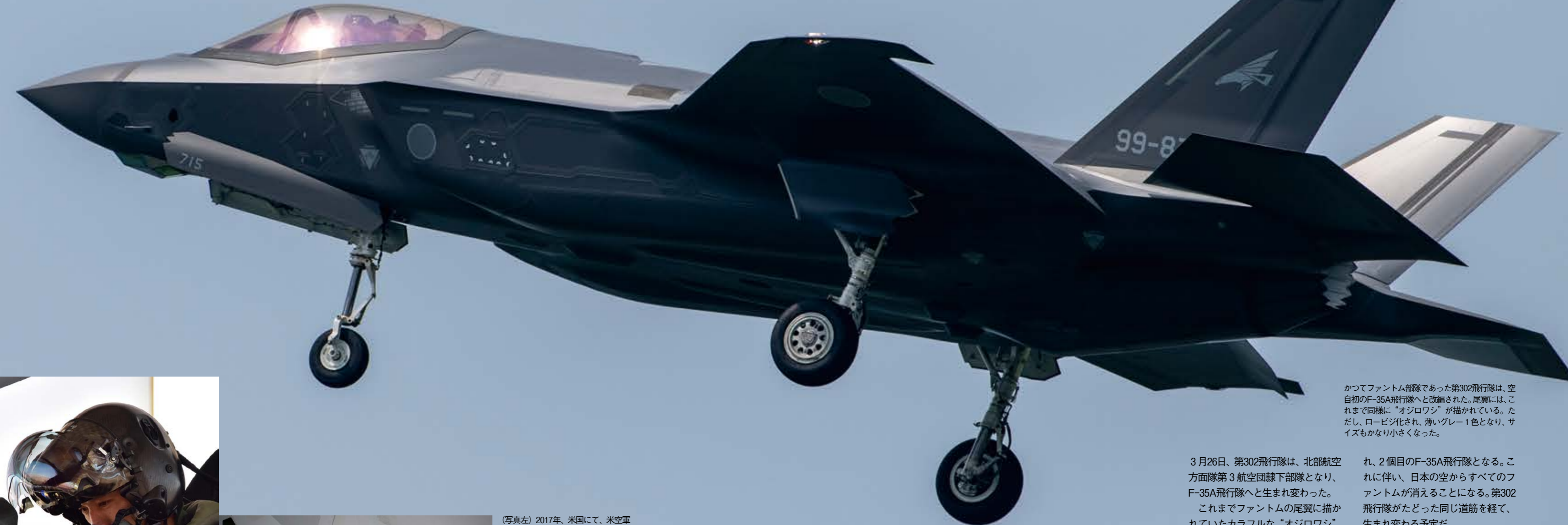
かつてファントム部隊であった第302飛行隊は、空自初のF-35A飛行隊へと改編された。尾翼には、これまで同様に“オジロワシ”が描かれている。ただし、ロービジ化され、薄いグレー1色となり、サイズもかなり小さくなった。

このようにF-35Aの受け入れ準備が着々と進む中、残念ながらF-4ファントムが退役していった。これまでファントム運用部隊であった「第302飛行隊」が、F-35A部隊となることが決まっており「臨時F-35A飛行隊」との合併準備も始まった。そして2018年1月26日、最初の1機が三