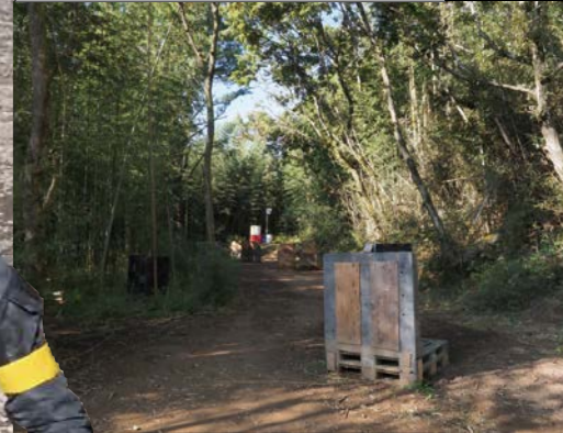
森林フィールドのCエリアはジャングル内の索敵に長けた射手なら思いのほかヒットが狙えるアングルもあって「くそ、どっから撃ってきたんだ!」と悔しがるのもいとおかし。