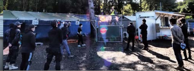
メシアを讃えし……もとい、朝のゲームミーティングに参加の皆さん。