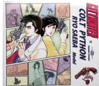
カバー裏側には、『シティーハンター』の主な登場人物と愛用のパイソンが描かれている。