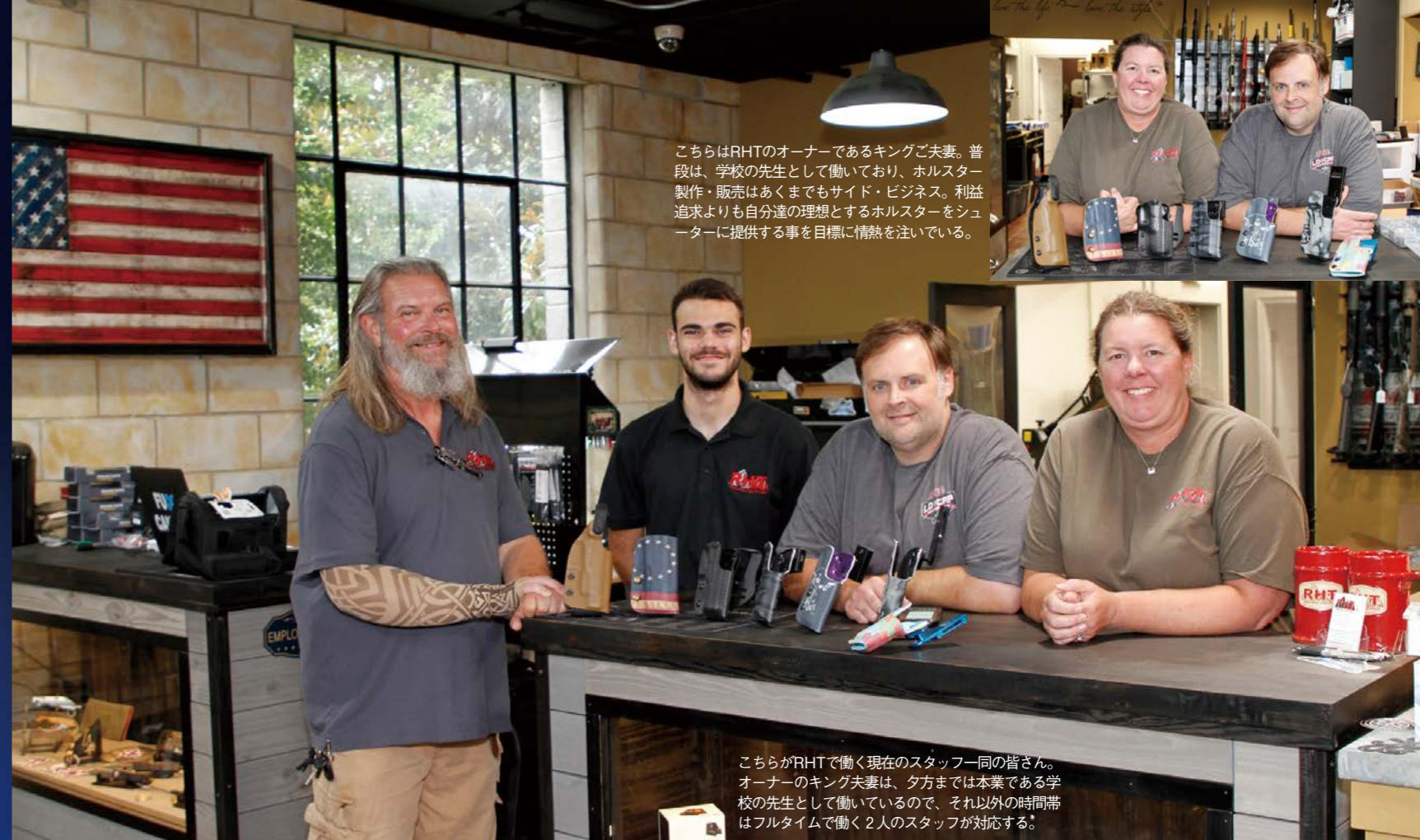
こちらはRHTのオーナーであるキングご夫妻。普段は、学校の先生として働いており、ホルスター製作・販売はあくまでもサイド・ビジネス。利益追求よりも自分達の理想とするホルスターをシューターに提供する事を目標に情熱を注いでいる。