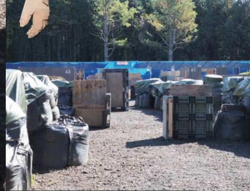
市街地とCQBが混在するA・Bフィールドはチームワークとエントリーテクニックで裏取りせよ! やはり「くそ、どっから撃ってきたんだ!」と悔しがるのも好き好きも也。