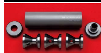
音響工学に基づいて新設計されたサイレンサー。タナカ・ワークスが独自に開発した「ドラム・パッフル」を内蔵して、高音域を抑え込んだ抜群の解群効果を発揮する。