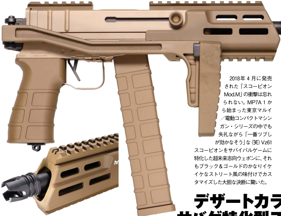
株式会社 東京マルイ ☎03-3605-1113 www.tokyo-marui.co.jp

ライフルングに沿って斜めにスリットが入った短めの4ブロングハイダーはMod.Dオリジナルの新規アルミ切削パーツ。前後逆に装着することでマスルガード的な外観に変更可能なリバーシブル構造はMod.M同様。取り外せば14mm逆ネジになっており、サブレッサー、トレーサー等のオプションに対応。