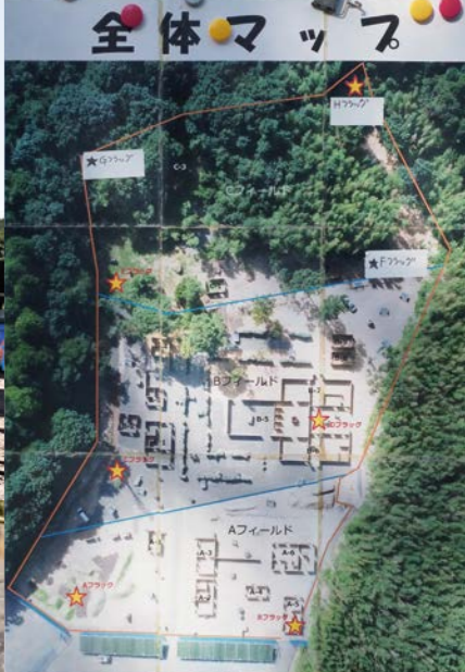
広大なフィールドは大きく3エリアに分けられ運用。ゲーム前どのエリアのどこのフラッグからスタートしますとのアナウンスで各チームがそれぞれの陣地へ向かいます。詳しくは https://www.tsukusaba.com/ 内の施設案内を参照のこと。