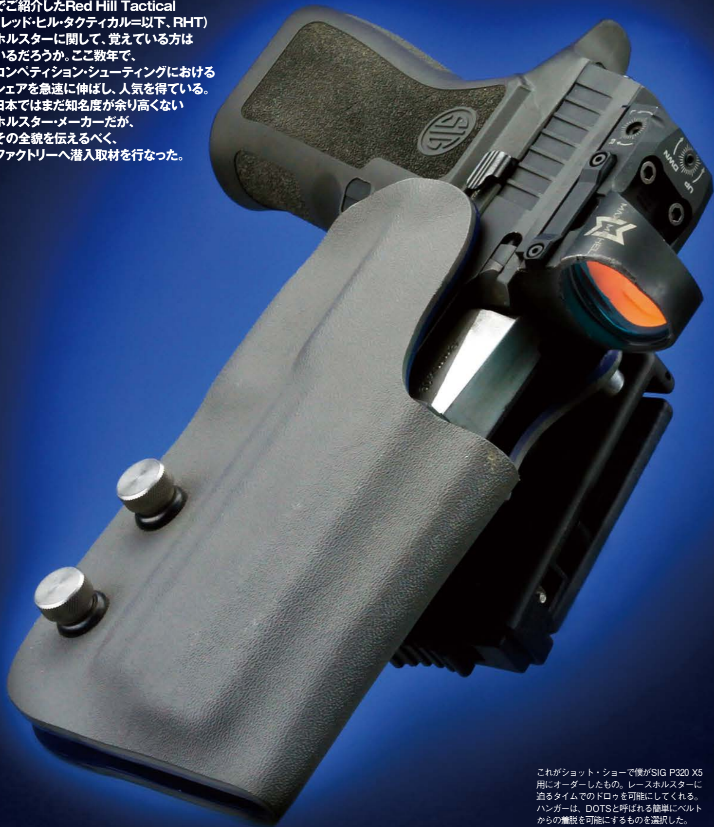
これがショット・ショーで僕がSIG P320 X5用にオーダーしたもの。レースホルスターに迫るタイムでのドロッを可能にしてくれる。ハンガーは、DOTSと呼ばれる簡単にベルトからの着脱を可能にするものを選択した。

今年のショット・ショー特集(2020年4月号、5月号)で紹介したRed Hill Tactical(レッド・ヒル・タクティカル=以下、RHT)ホルスターに関して、覚えていた方はいるだろうか。ここ数年で、コンペティション・シューティングにおけるシェアを急速に伸ばし、人気を得ている。日本ではまだ知名度が余り高くないホルスターメーカーだが、その全貌を伝えるべく、ファクトリーへ潜入取材を行なった。