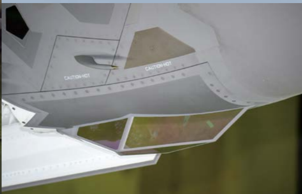
（写真左）2017年、米国にて、米空軍F-35教育プログラムを受ける空自パイロット。機体周囲には、複数のセンサーカメラが内蔵されており、その映像をつなぎ合わせて、360度の映像とし、ヘルメットバイザーに投影させることができる。