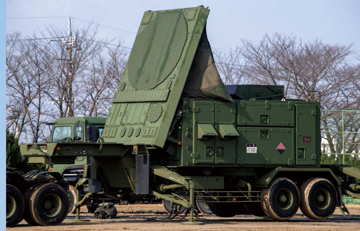
フェーズドアレイレーダー・多機能レーダーを備えたレーダー装置RS。 目標の探知から追尾、そしてミサイル誘導を行なうことが可能だ。