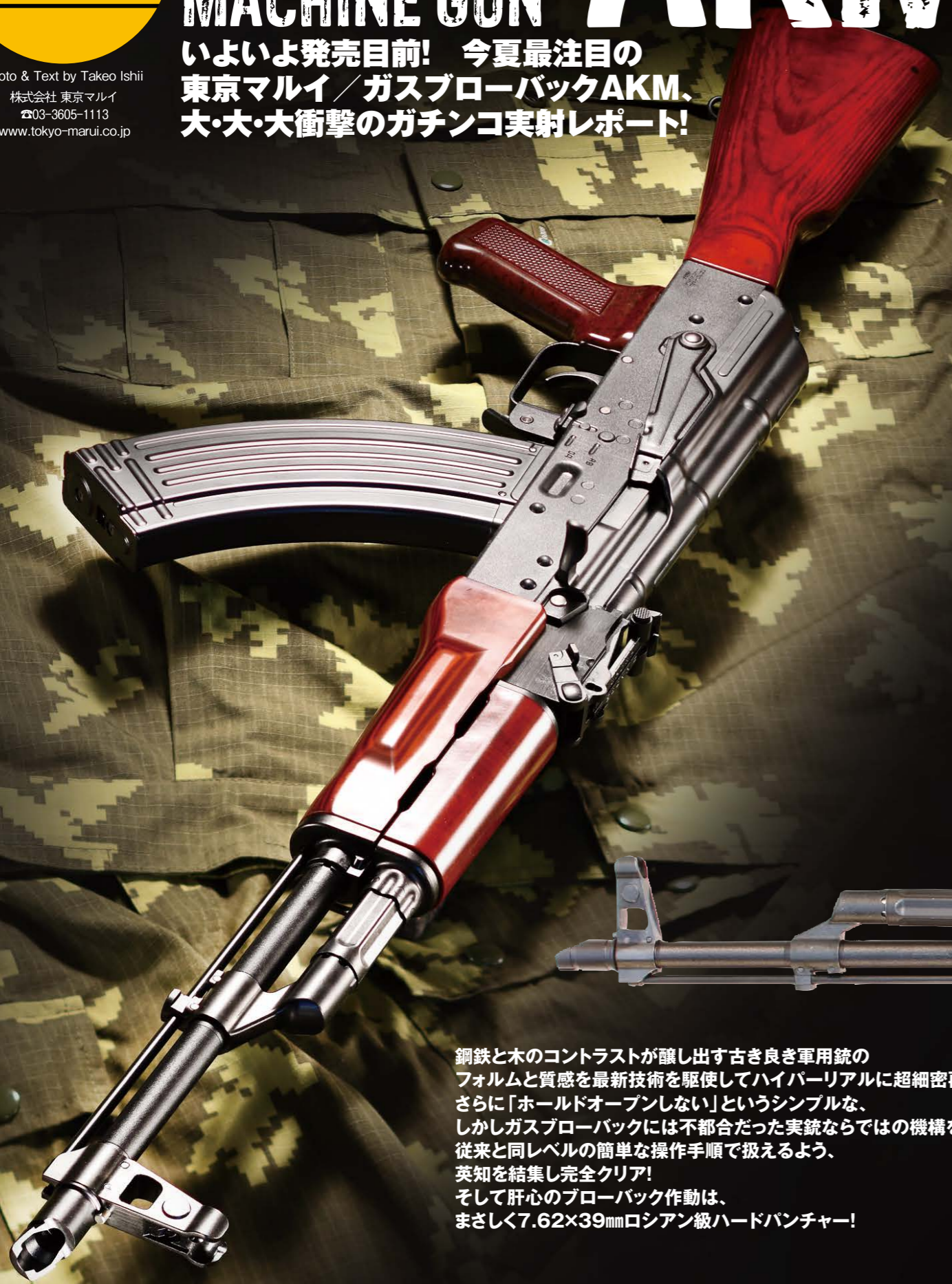
株式会社 東京マルイ ☎03-3605-1113 www.tokyo-marui.co.jp

鋼鉄と木のコントラストが醸し出す古き良き軍用銃の フォルムと質感を最新技術を駆使してハイパーリアルに超細密再現! さらに「ホールドオープンしない」というシンプルな、 しかしガスブローバックには不都合だった実銃ならではの機構を 従来と同レベルの簡単な操作手順で扱えるよう、 英知を結集し完全クリア! そして肝心のブローバック作動は、 まさしく7.62×39mmロシアン級ハードパンチャー!