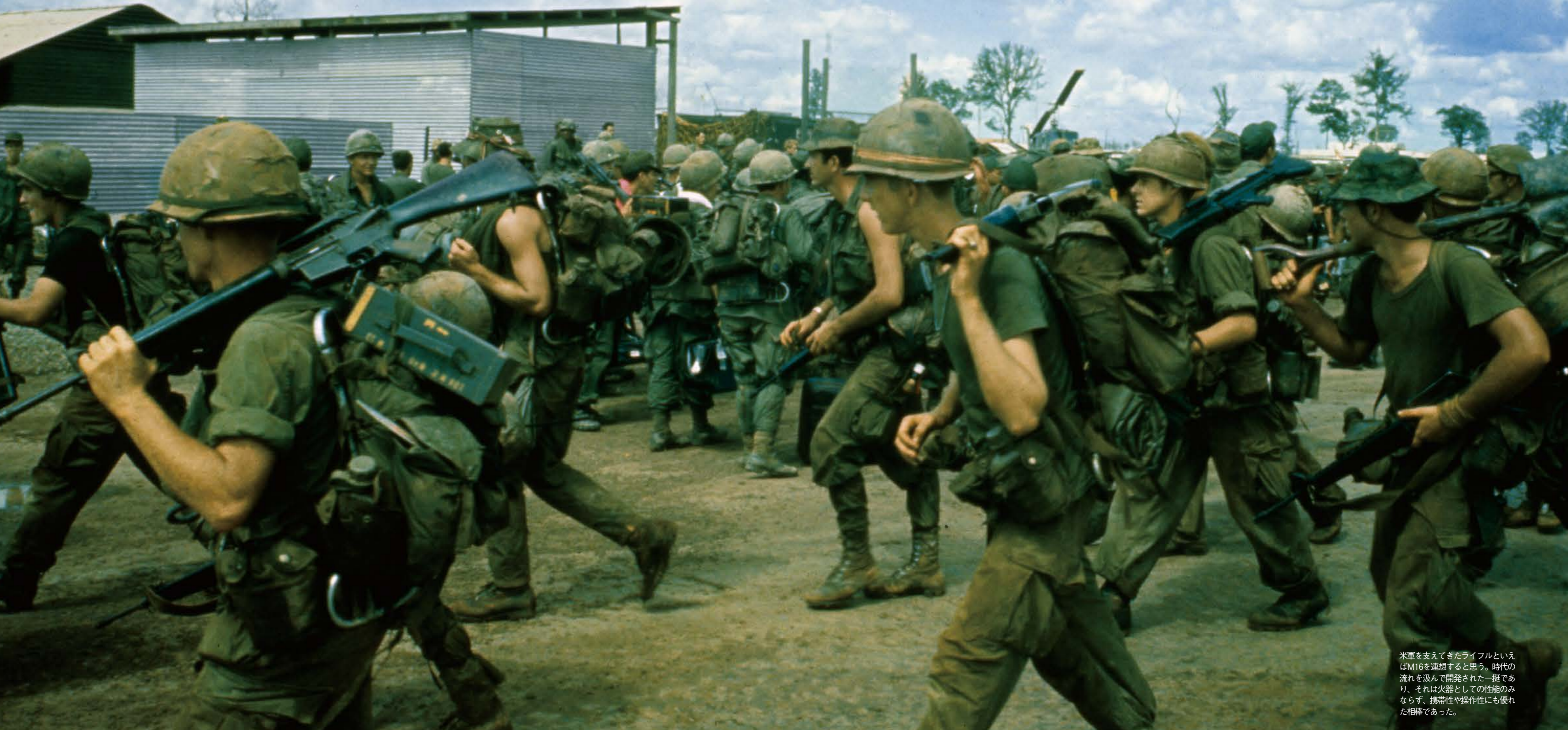
米軍を支えてきたライフルといえばM16を連想すると思う。時代の流れを汲んで開発された一挺であり、それは火器としての性能のみならず、携帯性や操作性にも優れた相棒であった。

ると絶対的に有利となり、その優位性は覆らないとされている。そこで米軍は硫黄島の戦いにおいて、絶対的優位から兵士数を日本軍の5倍にすると決めだが、日本兵の数を実数の2倍と勘違いし、結果10倍の兵士を送り込 (P27へ続く)