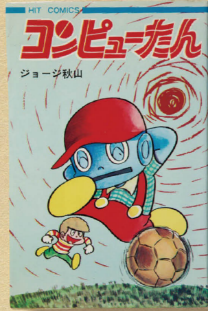
コンピュータん ジョージ秋山 価格1万3200円

ウルトラマン 価格9900円 ウルトラマンがテレビ放映された1966~67年当時、現代芸術社から月刊誌として刊行されていた雑誌。原作・上原正三、漫画・井上英沖のコンビによる2本の作品を収録し、第21・22話が収録されたこの号ではサイゴ・キアラとシーボーズが登場する。希少性も高く、マニア垂涎のシリーズとして知られる。カラー原稿の迫力も必見。