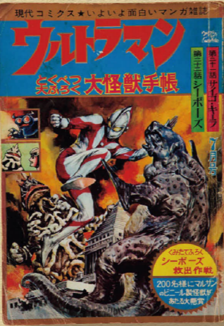
「いよいよ面白いマンガ雑誌」のコピーがエモい

ウルトラマン 価格9900円 ウルトラマンがテレビ放映された1966~67年当時、現代芸術社から月刊誌として刊行されていた雑誌。原作・上原正三、漫画・井上英沖のコンビによる2本の作品を収録し、第21・22話が収録されたこの号ではサイゴ・キアラとシーボーズが登場する。希少性も高く、マニア垂涎のシリーズとして知られる。カラー原稿の迫力も必見。