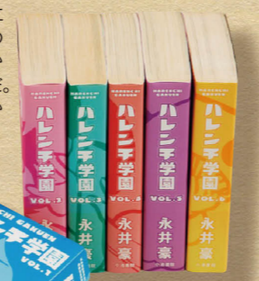
黒髪ロングヘアのヒロインの名は十兵衛!

1968年「週刊少年ジャンプ」掲載され爆発的ヒットとなると同時に、スカートめくりも流行。全国のPTAが有害図書だと騒ぎ立てるなど、当時物議を醸した永井豪初期の名作。漫画史に残る作品であり、2007年から復刻版として出版された全6巻セットだ。幾度もなく映画化もされ、平成に入ってからOVAが出るなど人気は衰え知らず。