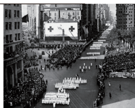
Illustration by Hiroshi Okamoto