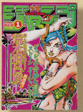
週刊少年ジャンプ 2000年1号 価格8800円

「ジョジョの奇妙な冒険第6部ストーンオーシャン」が新連載となり、空条承太郎の娘である主人公の空条徐倫が表紙に。昨年アニメ化された最近の作品のようなイメージだが、これが実に22年前の少年ジャンプである。高橋和希作「遊☆戯☆王」や許斐剛作「テニスの王子様」、森田まさのり作「ROOKIES」などの連載が名を連ねる。