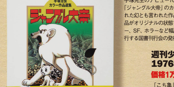
手塚治虫 カラー作品選集 ジャングル大帝 価格8800円

手塚先生のデビュー70周年となる2016年に刊行された「ジャングル大帝」のカラー版。学年誌や幼年誌に掲載された幻とも言われた作品で、虫プロの手によるカラー作品がオリジナルの状態と完全復刻。海外文学やミステリー、SF、ホラーなど幅広いジャンルで独創的な書籍を刊行する国書刊行会の発行。定価10000円の豪華本だ。