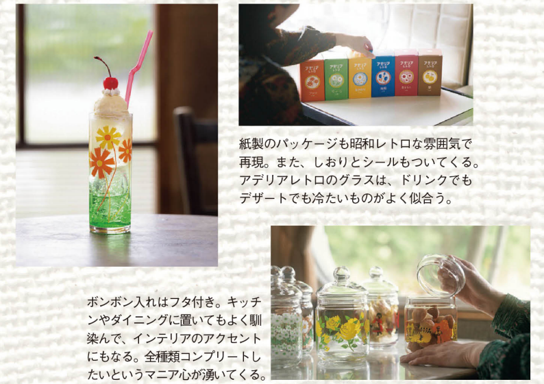
紙製のパッケージも昭和レトロな雰囲気で再現。また、しおりとシールもついてくる。アデリアレトロのグラスは、ドリンクでもデザートでも冷たいものがよく似合う。