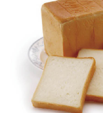
(ロイヤルブレッド)

ホテルの朝食でお馴染みの「ロイヤルブレッド」は、重量感ときめ細やかな歯ごたえと口溶けが絶妙。「チーズロード」はチェダーチーズの風味とパン生地の甘さを堪能。「抹茶大納言」は北海道産小豆「大納言」と愛知県西尾「あいや」の抹茶を使用。風味豊かなマーガリンもセット。