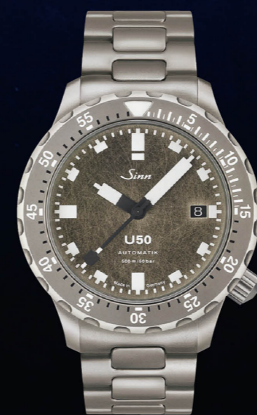
U50.DS 世界限定1000本。手作業でスクラッチ加工された文字盤が特徴。フルテグメント加工。直径41mm。厚さ11.2mm。セリタ社の自動巻きCal. SW300-1を搭載。価格63万8000円