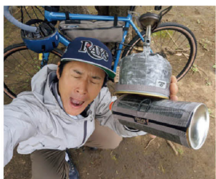
OD缶の下に持っているのは、「CB CAN COVER」を巻いたCB缶。表地はダイニーマで裏地がコーデュランイロン。

前述の通り、自転車やバイクパ ッキングやキャンブツーリングな どをすると、どうしても振動で金 属製品同士がぶつかりカチャカ チャ音がする。 ところが、フレームバッグやパ ニアバッグに入れても、こちらの OD缶カバーがあれば、クッカー、