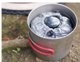
クッカーの中を傷つけないのがイイ! もちろん自転車 のフレームバッグに入れて も音が鳴らない。

「Camp, Cycling, Pknic, Hiking」 の頭文字を取ってネーミングに したそうだ。