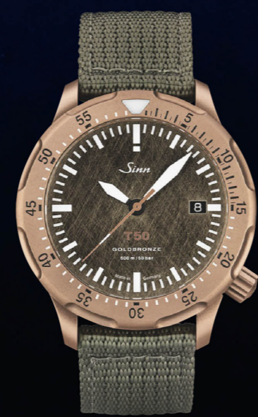
T50.GOLDBRONZE 世界限定300本。ゴールドを12.5%混合した新素材のブロンズ合金「ゴールドブロンズ125」を裏蓋以外に採用。スクラッチ加工文字盤。テキスタイルストラップ。500m防水。価格110万円