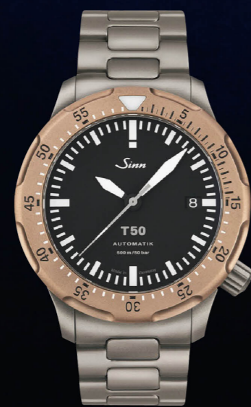
T50.GBDR 新素材のゴールドブロンズ125を回転ベセルのみに採用。それ以外はチタン製。ケースサイズは直径41mm×厚さ12.3mm。Arドライテクノロジー。500m防水。価格90万6400円