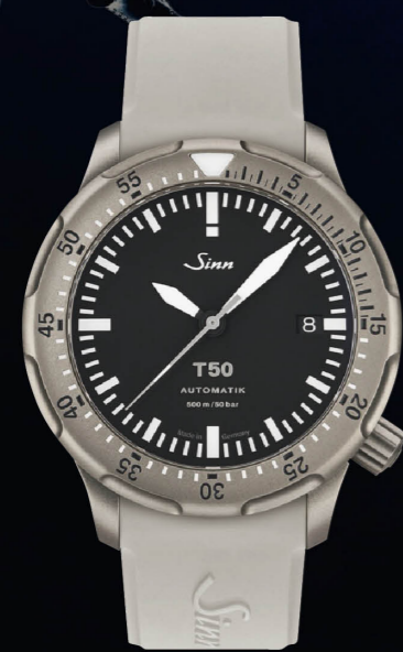
T50 グレード5のチタン合金製。テグメント加工の特殊結合方式と安全システム搭載の逆回転防止ベゼル。500m防水。セリタ社の自動巻きCal. SW300-1を搭載。価格74万8000円

計は水に入る。ダイバーズウォッチの誕生だ。ジンのダイバーズは、すべてのUシリーズでUポートスチールを使用する。これはドイツ海軍の212クラスの新原子力潜水艦の外殻のために開発された特殊鋼である。海水と長期間接触しても、高い耐性を発揮する。同時に非磁性素材であり、ひび割れにも高い耐性を示す。通常の時計ケースに使われる316Lステンレス鋼の1・55倍を超す強度がある。