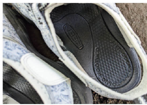
クッション性の高いフットベッドは、天然原料による防臭加工がされている。アウトソールは水辺や不整地に対応している。