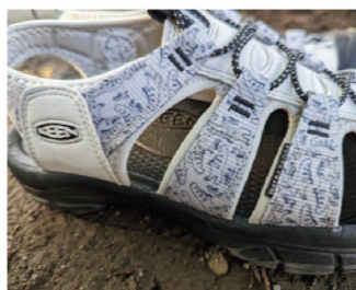
近くで見ると分かるがニューポートのイラストがたくさん散りばめられている柄がカワイイ。アッパーは防水素材。

僕は、毎年夏になるとニューポートのデザイン型に日焼けをしまつくりデイリーユースしてしまふ。ファッションにも合わせやすく、ルックスがいいだけでなく、機能性が高いのがその理由。アッパーの根幹に水や汚れに強いウオータープルーフのポリエステル素材を使用していることで、速乾性に優れ、お手入れもとても簡単。履き口は伸縮性のある素材で、靴紐の代わりにバンジーコードが付いているため、脱ぎ履きが非常にラクだ。自分は中高で足幅が広いので、あえてワンサイズアップ(11cm)するようにしている。アウトソールのパターンはキーンオリジナル。ブロックパターンを見て分かる通り、土の道芝生、砂利道などのあらゆる地面でグリップする。それだけでなく、ウ