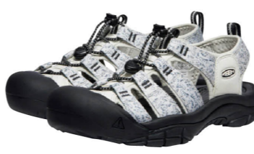
ニューポートレトロの20周年限定カラー「Newport/Mcnewport」。その他、カラーバリエーションは豊富に揃っている。