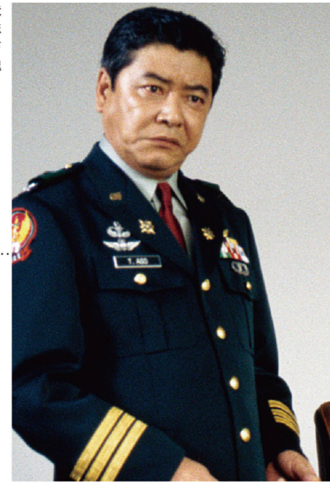
『ゴジラVSメカゴジラ』