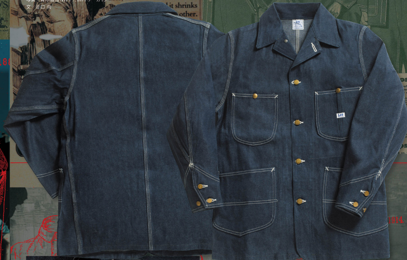
文 谷口尚

ハイテク素材を使用し高機能を競うウェアがある一方で、伝統的なスタイルを守り続けるウェアがある。それらが時代を超えて人気を集めるのは、ワークウェアとしてひとつの完成形に到達しているからだ。決して古くならない伝統のウェアを紹介しよう。