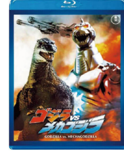
『ゴジラVSメカゴジラ（東宝Blu-ray名作セレクション）』好評発売中 価格3850円 発売・販売元：東宝 ©1993 TOHO CO.,LTD. 対ゴジラ戦闘部隊Gフォースが、麻生司令官と共に初登場した。